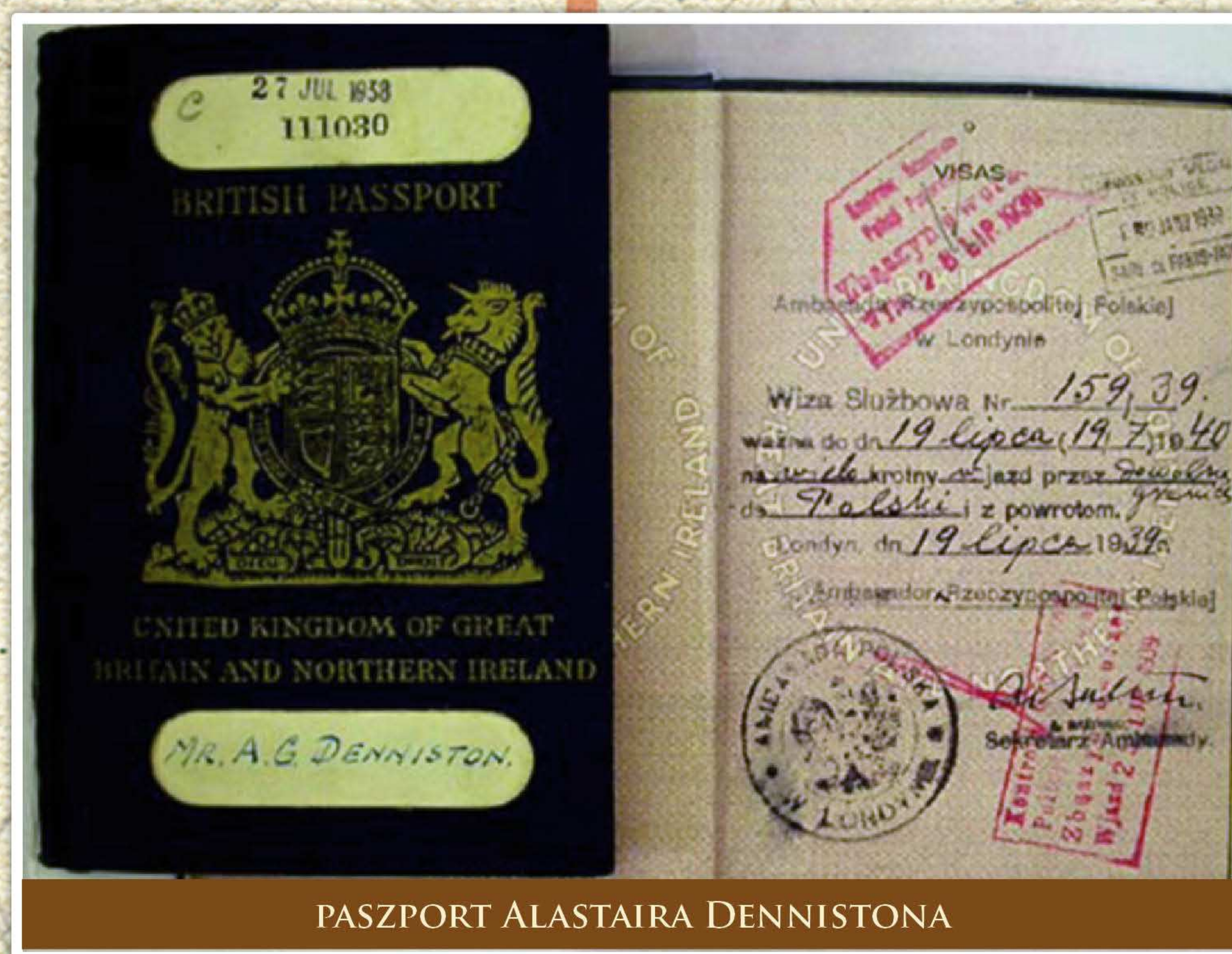
PASZPORT ALASTAIRA DENNISTONA