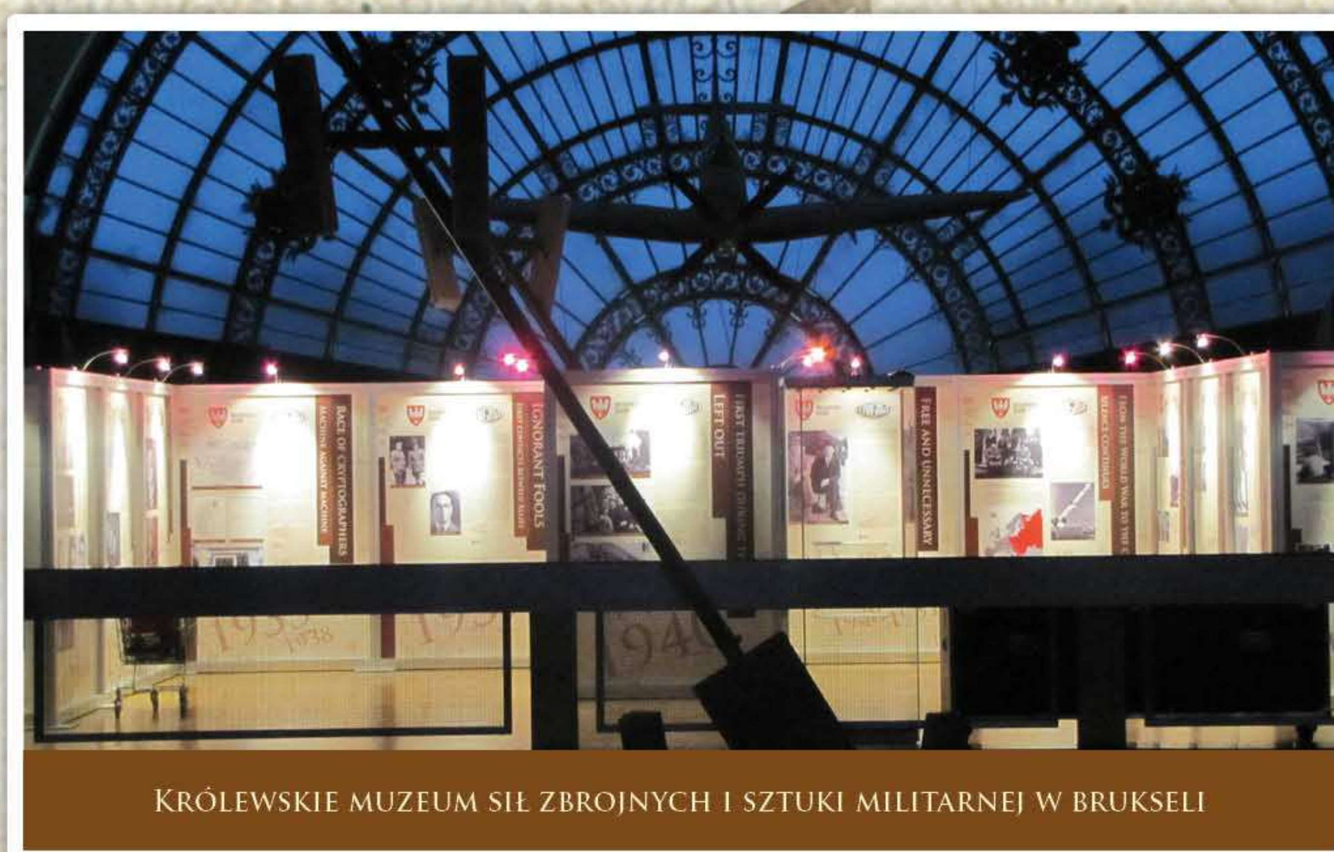
KRÓLEWSKIE MUZEUM SIŁ ZBROJNYCH I SZTUKI MILITARNEJ W BRUKSELI

MARSZAŁEK WOJEWÓDZTWA WIELKOPOLSKIEGO ODSŁANIA W POZNANIU POMNIK POŚWIĘCONY WIELKIEJ TRÓJCE POLSKICH MATEMATYKÓW